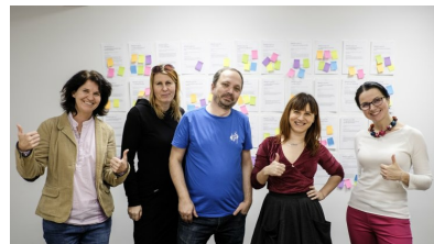
▲ Jury wyłoniło zwycięskie pomysły na projekty edukacyjne.

Kolejnych 15 pomysłów wybrali internauci w odrębnym głosowaniu. Łącznie przyznanych zostało więc 75 grantów finansowych, które pomogą zmienić naukę w przygodę. Serdecznie gratulujemy uczestnikom i laureatom!