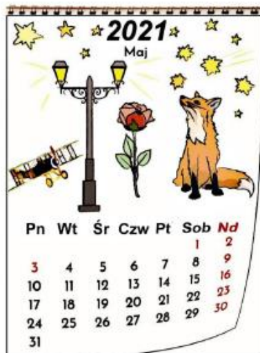
Karta nr 1