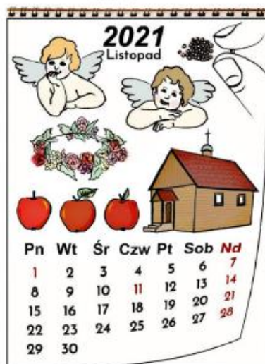
Karta nr 3