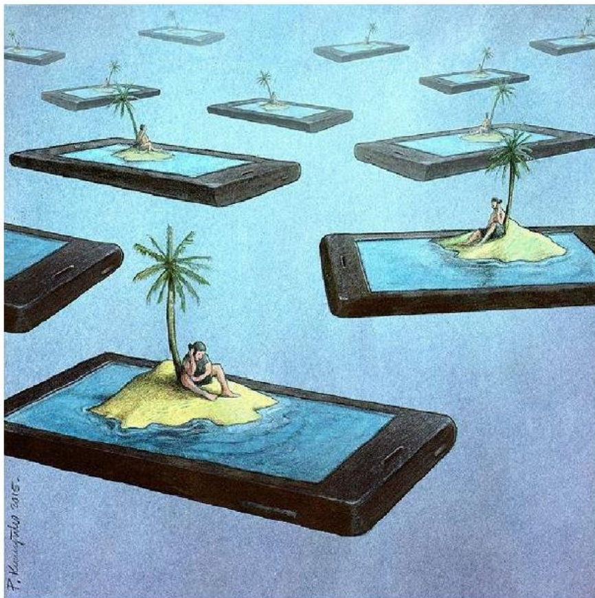
Paweł Kuczyński, Wyspy , www.digitalyouth.pl

Czy grafika Pawła Kuczyńskiego mogłaby być ilustracją do tekstu Pochwała przyjaźni ? Uzasadnij swoją odpowiedź.